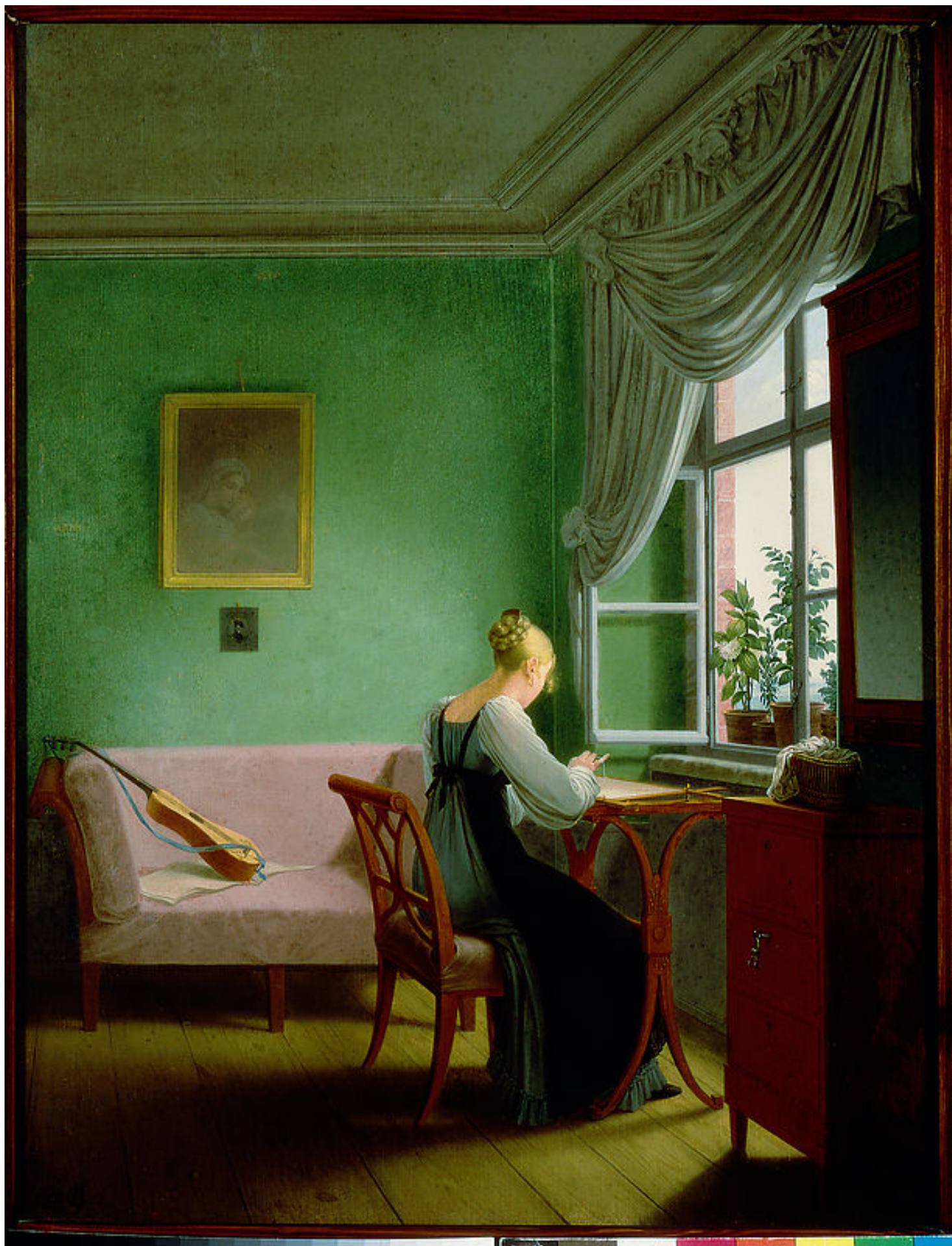
Hafciarka, 1817, Georg Friedrich Kersting, Muzeum Narodowe w Warszawie