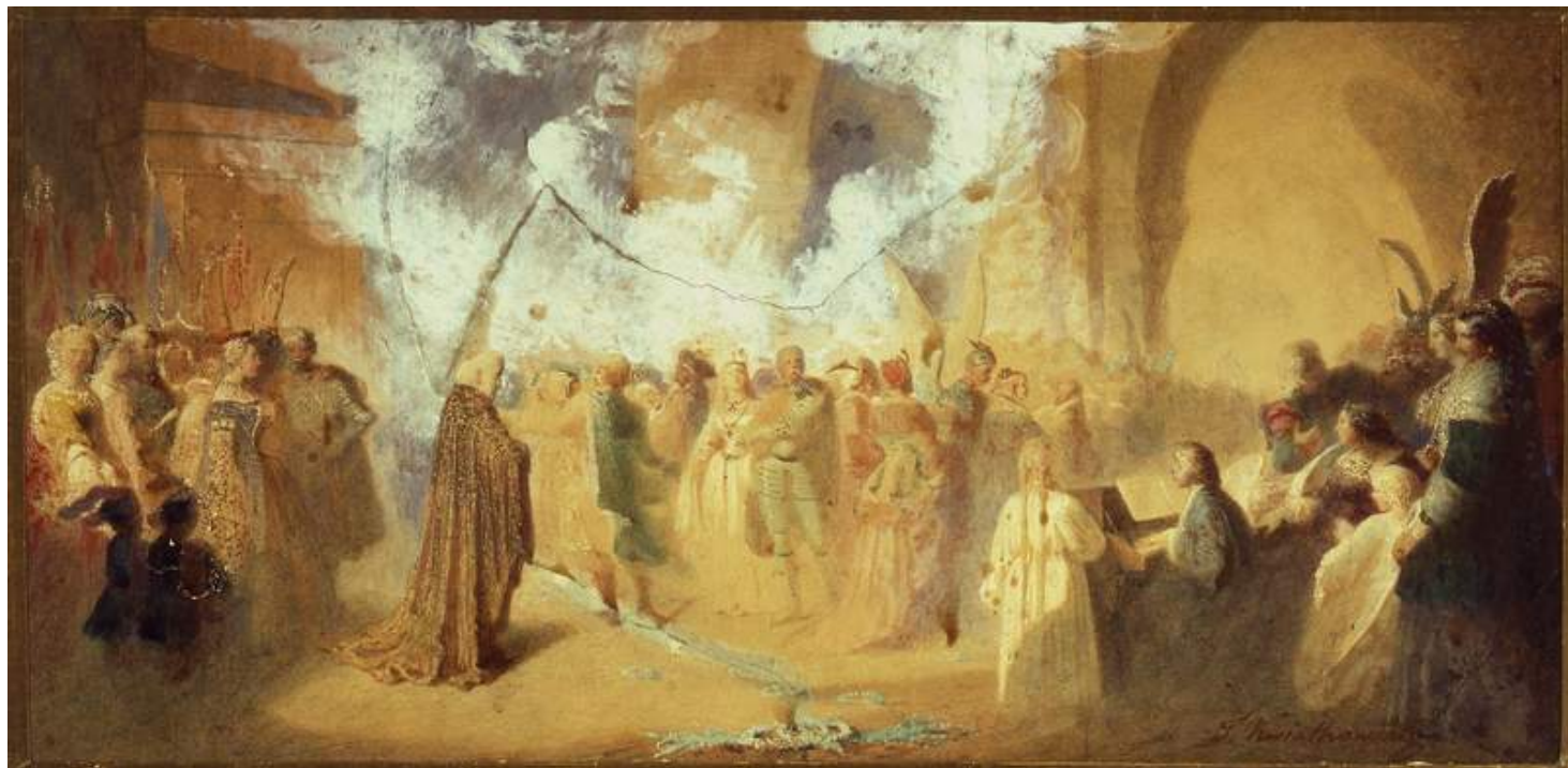
Polonez Chopina. Bal w Hôtel Lambert, Teofil Kwiatkowski, po 1862, Akwarela, Muzeum Narodowe w Warszawie

Początek XIX wieku wiąże się w muzyce z nazwiskiem Ludwiga van Beethovena , najmłodszego klasyka wiedeńskiego. W jego muzyce odnajdziemy zaчатки wielu zjawisk, które decydowały o kształcie muzyki tworzonej przez kolejne generacje kompozytorów-romantyków. Od początku XIX w. prężnie rozwijała się też twórczość wirtuozowska — określana stylem brillant .