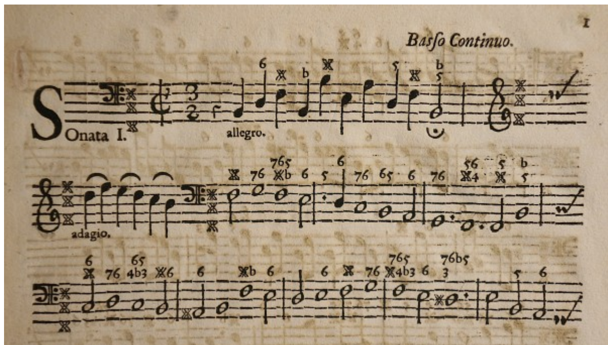
Zapis basu cyfrowanego

W barokowej muzyce zespołowej stosowano powszechnie bas cyfrowany czyli skrótowy, wykorzystujący cyfry zapis akordów zbudowanych na dźwiękach melodii basowej.