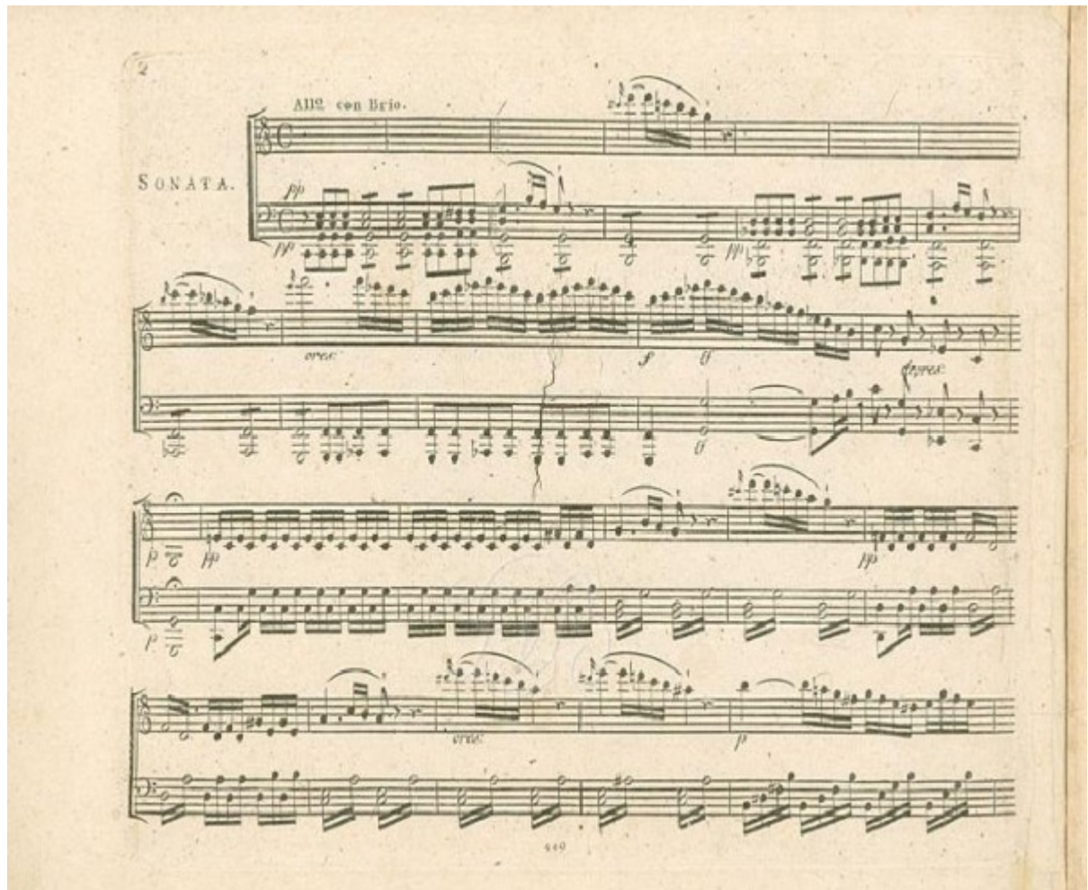
Sonata Waldsteinowska Ludwiga van Beethovena

Dopiero w XX wieku w efekcie wprowadzania niekonwencjonalnych technik kompozytorskich i nietypowych instrumentów zaczęto czasami stosować notacje różniące się zasadniczo od notacji tradycyjnej.