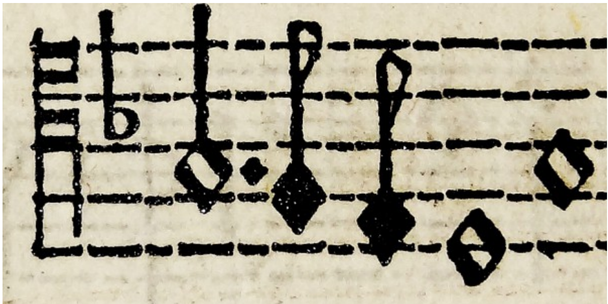
Biała notacja menzuralna - druk z XVI wieku