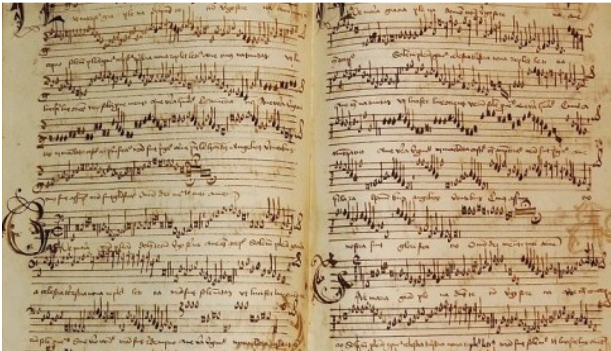
Biała notacja menzuralna - kodeks 2016

Na terenie Niemiec stosowano zapis lutniowy, w którym każdy możliwy do zagrania dźwięk miał inny symbol – literowy lub cyfrowy. Pod koniec XVI wieku muzycy niemieccy przestawili się na używanie zapisu francuskiego i niektórzy posługiwali się nim jeszcze w XVIII wieku. W tym czasie tabulatury należały już jednak do rzadkości, a muzykę przeznaczoną na instrument solowy najczęściej zapisywano takimi samymi nutami, jak muzykę wokalną.