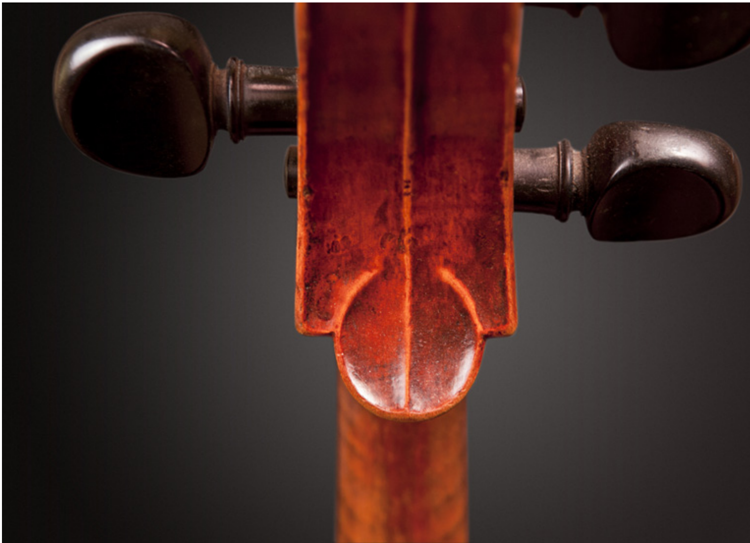
tył główki wiolonczeli z kołkami