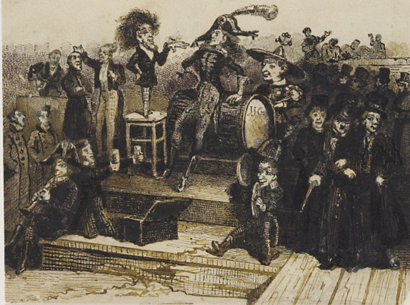
Występ orkiestry pod batutą karła, Jean-Jacques Grandville, po 1830, Francja, Muzeum Narodowe w Warszawie