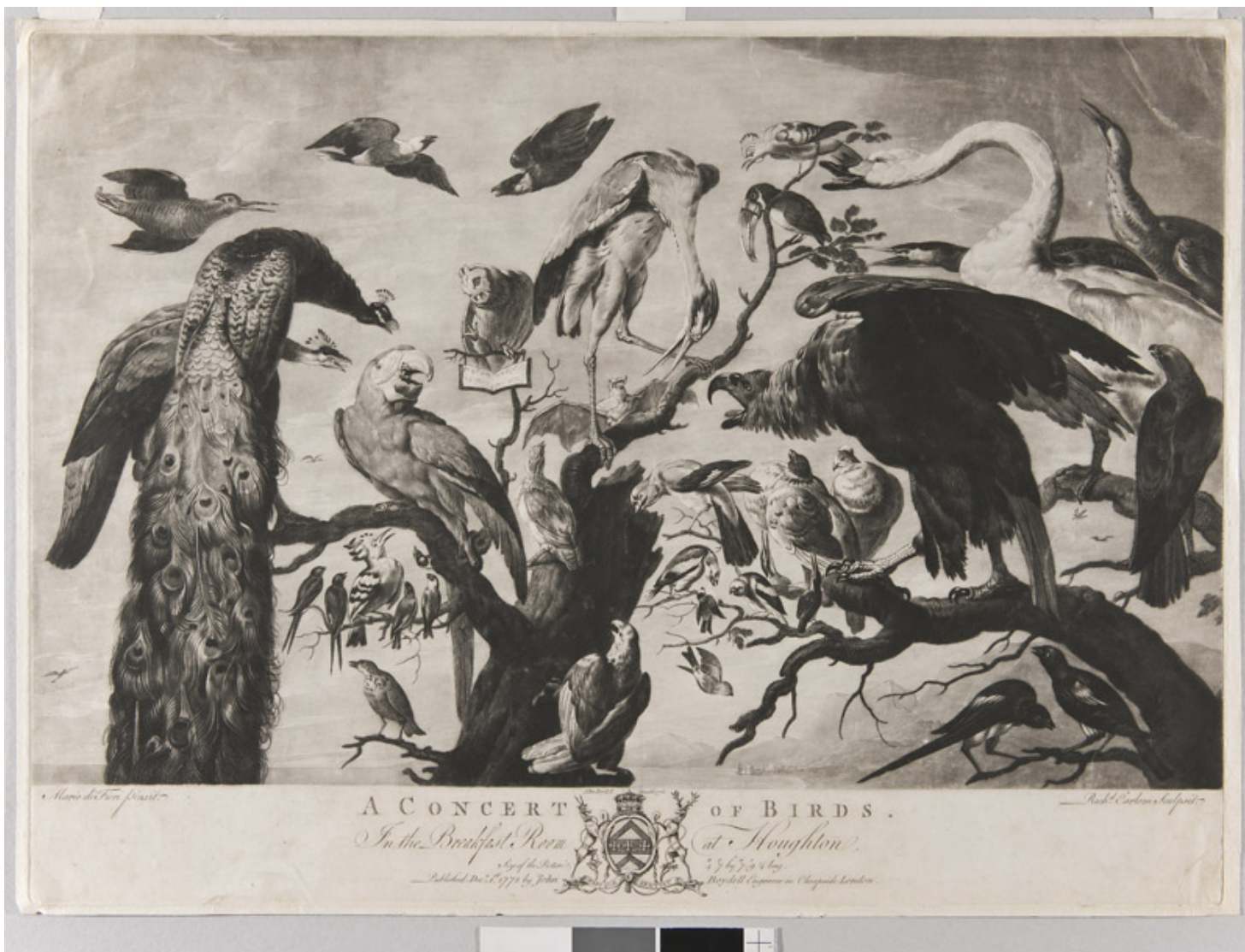
Ptasi koncert, 1778, Richard Earlom, Muzeum Narodowe w Warszawie

Początek epoki klasycznej wyznacza styl galant , który czasowo obejmuje lata 1720-1780. Jednym z pierwszych wyrazieli klasycyzmu był Johann Mattheson, którego zdaniem prąd ten miał uosabiać nowy racjonalny styl, stojący w opozycji do tradycji, przede wszystkim do muzyki barokowej nasyconej kontrapunktem , skomplikowanej, coraz trudniejszej i nudniejszej w odbiorze ( Das neu-eröffnete Orchestre , 1713 r.). Warto pamiętać, że w tym okresie twórczość Jana Sebastiana Bacha wydawała się współczesnym zbyt uczona i monotonna, chociaż doceniano mistrzostwo warsztatu lipskiego mistrza i jego umiejętności wykonawcze.